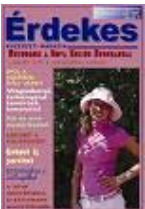
[2007. 3.szám ]