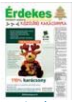
[2007. karácsony ]