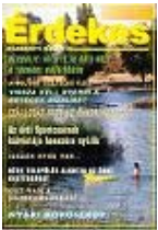
[2007. 4.szám ]