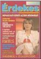
[2007. 5.szám ]