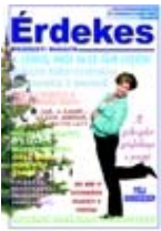
[2007. 6.szám ]