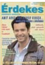
[2007. 1.szám ]